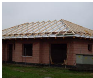
> nadkroevní systém