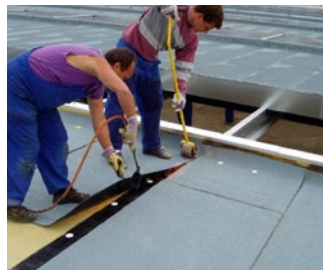
> ploché střechy