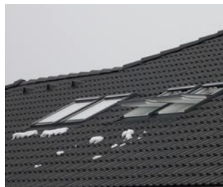
> klasická okna