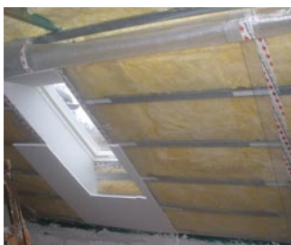
> zateplení podkroví