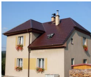
> plechové krytiny