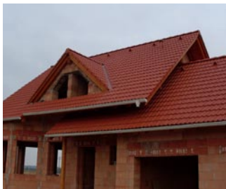
> skládané krytiny