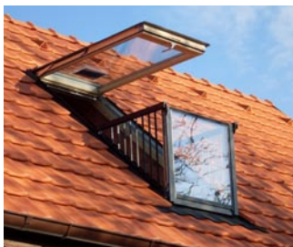
> balkónové okno