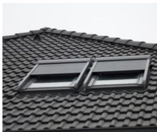
> elektricky ovládaná okna